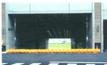
スタジアムゲート入口