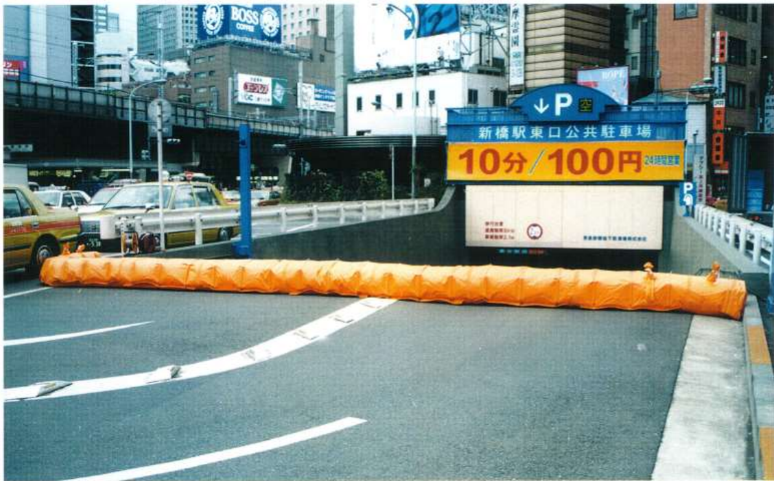
設置例 地下駐車場入口・長さ9.6m×幅1.7m×高さ0.3m 収納時寸法：長さ1.3m×幅0.6m×高さ0.6m

集中豪雨、水道管破裂等の 予期しない ビル や 地下街 や 地下駐車場の 浸水にすばやく対応！ 大切な財産を守ります。