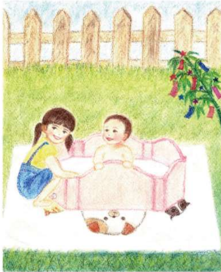
Illustration by Makiko Yamaguchi