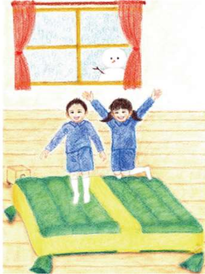
Illustration by Makiko Yamaguchi