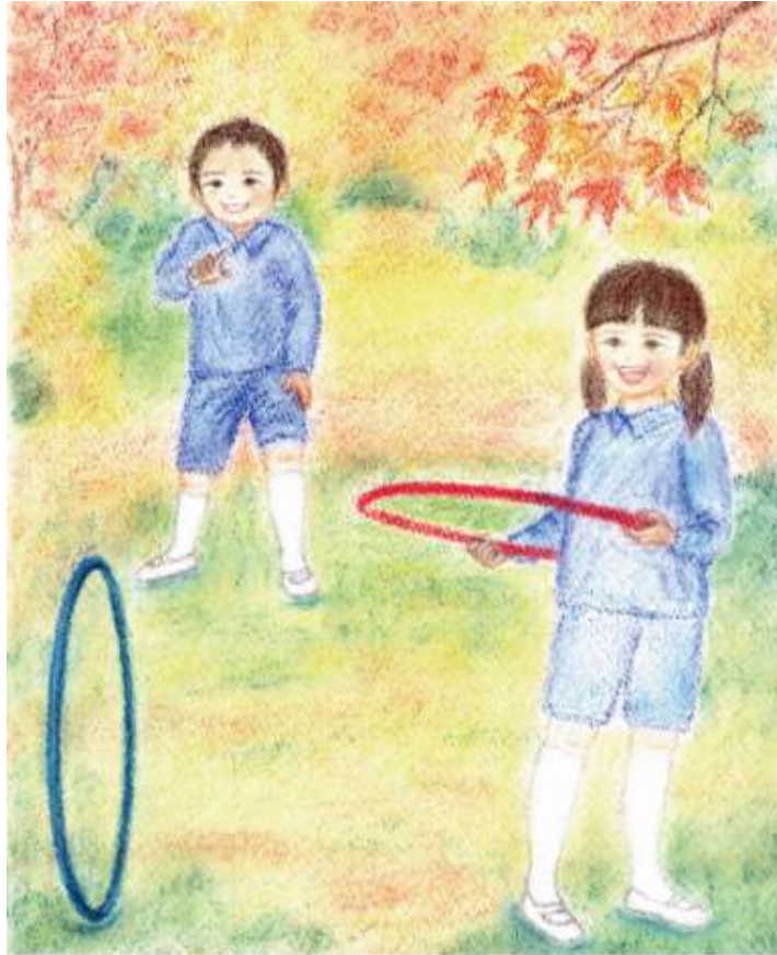
Illustration by Makiko Yamaguchi