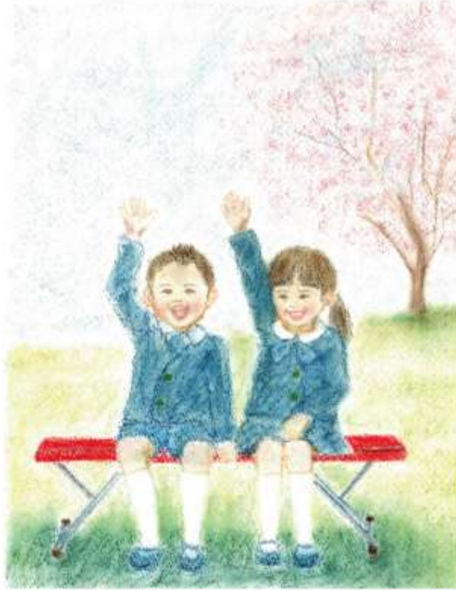
Illustration by Makiko Yamaguchi