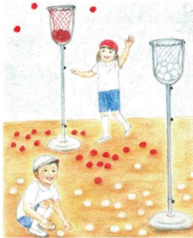
Illustration by Makiko Yamaguchi