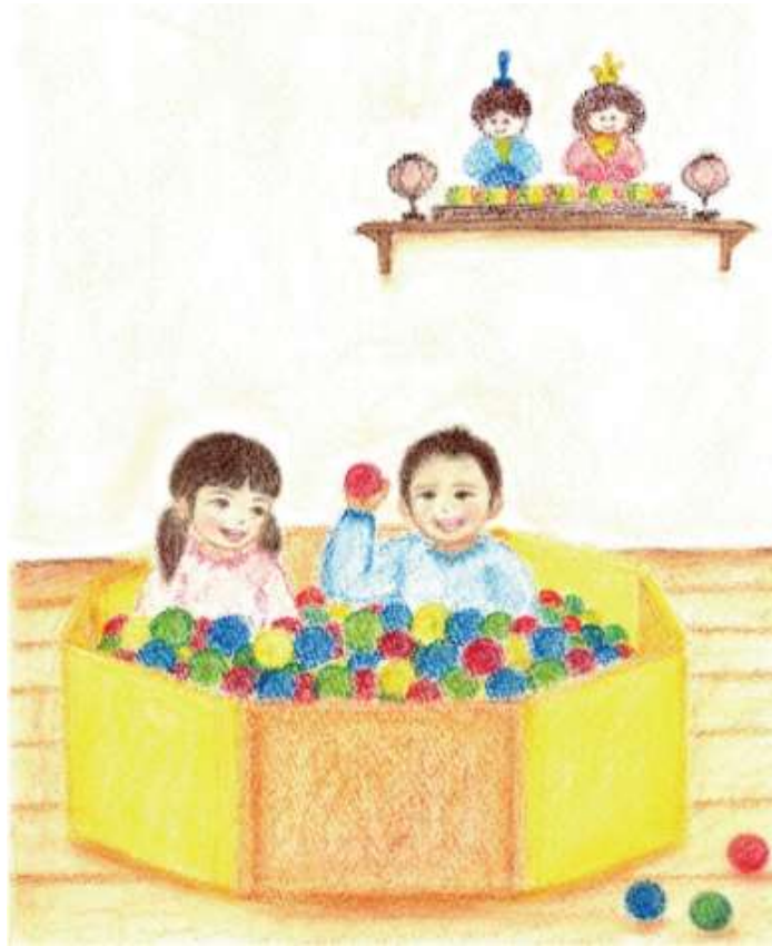
Illustration by Makiko Yamaguchi