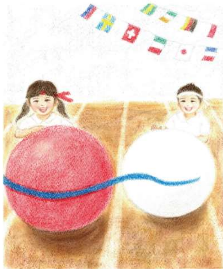
Illustration by Makiko Yamaguchi