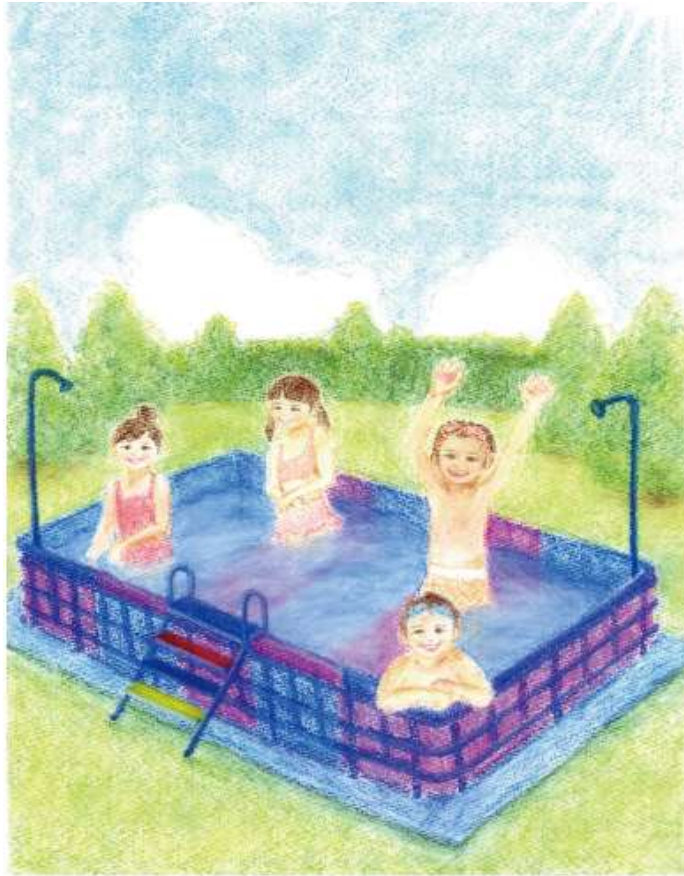
Illustration by Makiko Yamaguchi