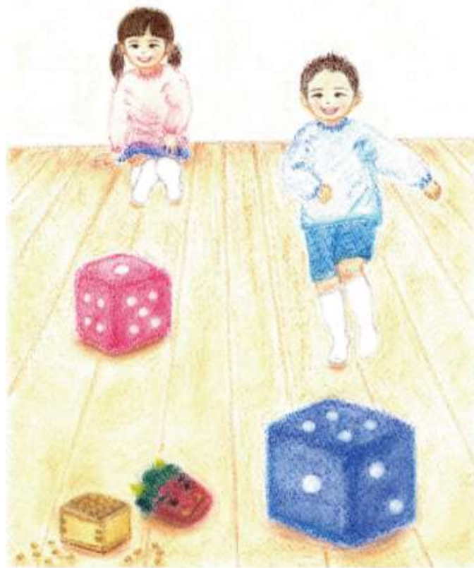
Illustration by Makiko Yamaguchi