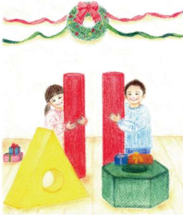
Illustration by Makiko Yamaguchi