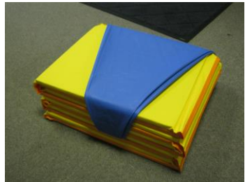
⑦折り返し、隙間に差し込んで完成。