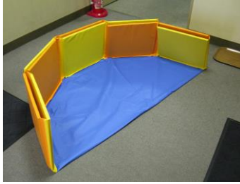
②半分に折りたたむ