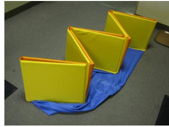
③パネルを互い違いに