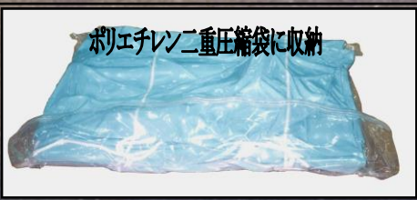
ポリエチレン二重圧縮袋に収納